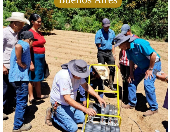
Grupo Productivo Buenos Aires